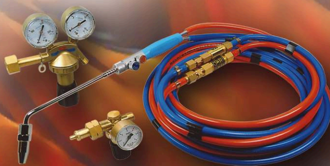
ZESTAW DO TOPIENIA

Rotomaty od ponad 15 lat pracują w najcięższych warunkach, można mieć absolutną pewność co do ich niezawodności i wytrzymałości.