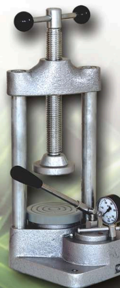
PRASA HYDRAULICZNA REF. PH